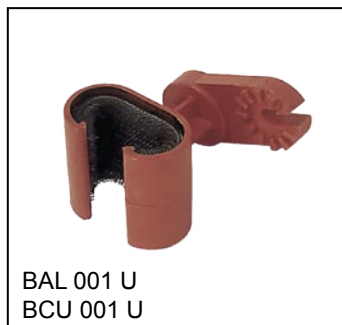
BAL 001 U BCU 001 U