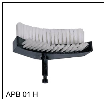
APB 01 H