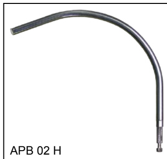
APB 02 H