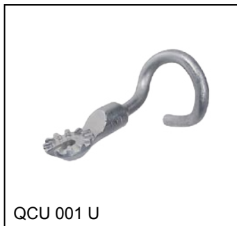
QCU 001 U