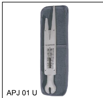
APJ 01 U