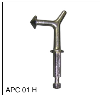
APC 01 H