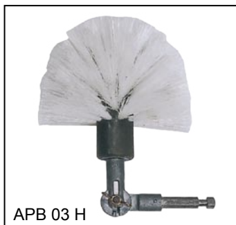
APB 03 H