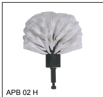
APB 02 H