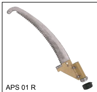
APS 01 R