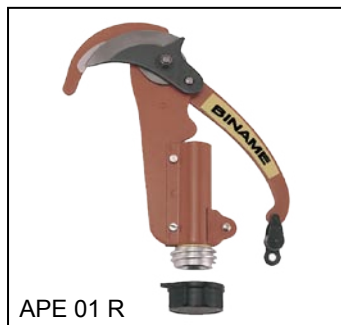
APE 01 R