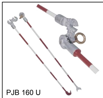
PJB 160 U