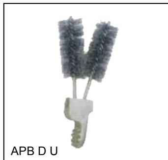
APB D U